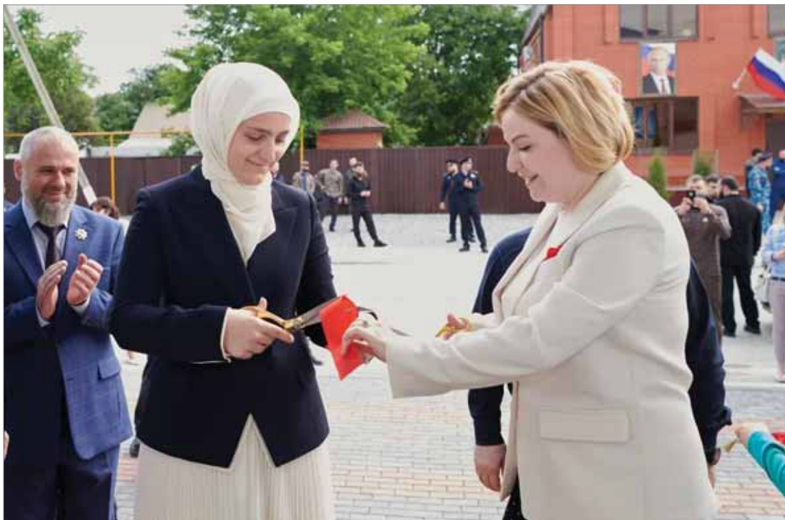
МИНИСТР КУЛЬТУРЫ РОССИИ О.Б. ЛЮБИМОВА НА ОТКРЫТИИ ЦЕНТРАЛЬНОЙ РАЙОННОЙ БИБЛИОТЕКИ ЦБС ШЕЛКОВСКОГО МУНИЦИПАЛЬНОГО РАЙОНА, ЧЕЧЕНСКАЯ РЕСПУБЛИКА

Местные власти также активно поддерживают реализацию проекта. В отдельных регионах, например, в Самарской области и Чеченской Республике за 2019—2021 гг. откроется не менее 14 модельных библиотек. Некоторые субъекты Российской Федерации становятся лидерами по созданию библиотек за счет средств регионального бюджета, например Кемеровская область, Республика Коми, Челябинская область.