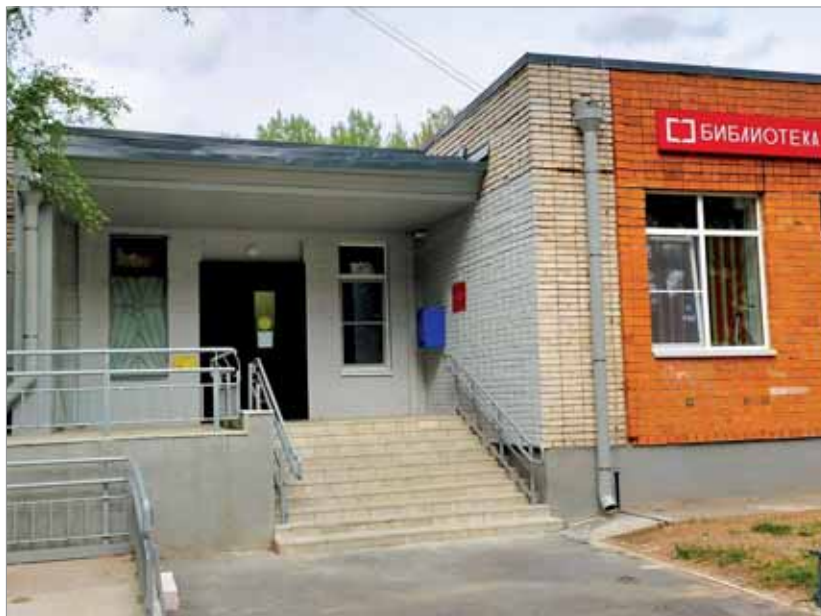
ВХОД В БИБЛИОТЕКУ РЕАЛИЗОВАН С УЧЕТОМ ТРЕБОВАНИЙ ДОСТУПНОЙ СРЕДЫ

Кроме того, «БиблиоЛюб» — единственное досуговое учреждение, обслуживающее местное население — почти 6 тыс. человек. Других учреждений культуры, спорта, социального назначения, дополнительного образования здесь нет.