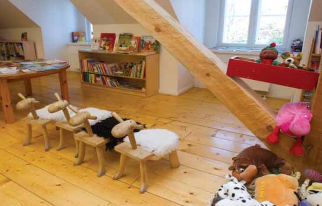
ДЕТСКАЯ БИБЛИОТЕКА ХААПСАЛУ

статочное полное представление о текущем состоянии публичных библиотек.