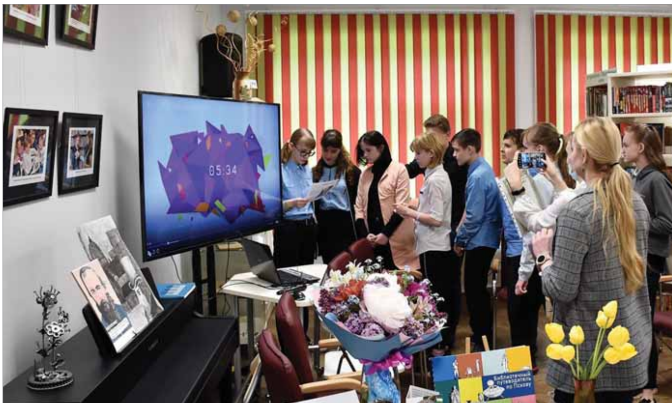
МОЛОДЕЖЬ АКТИВНО ПРЕДЛАГАЕТ ТЕМЫ И ФОРМАТЫ ОБЩЕНИЯ В БИБЛИОТЕКЕ

тивности и общения, она приобретает функцию социальную: проведение мероприятий и выстраивание коммуникации. Именно от формата мероприятий, когда люди собираются вместе и через различные виды активности взаимодействуют друг с другом, исходила концепция модернизации пространства нашей библиотеки. Комфорт и польза при любом виде деятельности и внешнем взаимодействии!