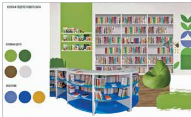
ДИЗАЙН-КОНЦЕПЦИЯ (КОЛЛАЖ) ПОДРОСТКОВОГО ЗАЛА

чество с экологическими, учебными, общественными, неправительственными организациями; организация фото- и видеоэкспозиций; проведение литературных и музыкальных вечеров с участием местных поэтов, писателей, художников.