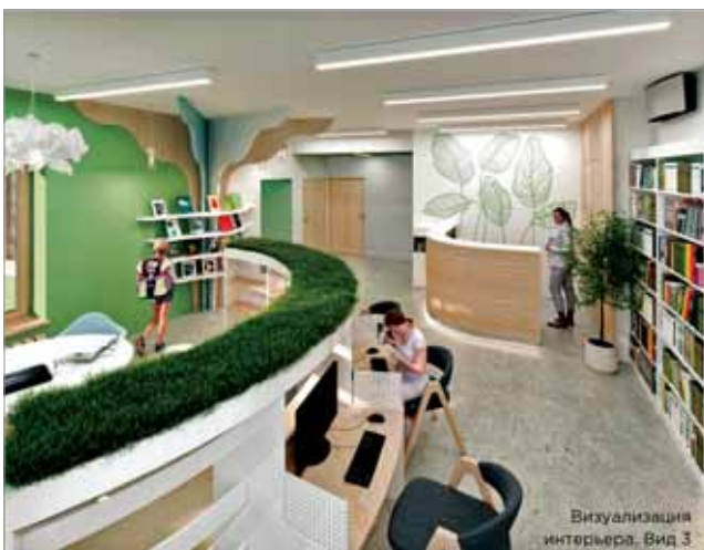
ДИЗАЙН-ПРОЕКТ НОВОЙ БИБЛИОТЕКИ № 250

Модернизация библиотек должна способствовать качественному информационно-библиотечному обслуживанию в оборудованных общественных пространствах, организации конкурентоспособных социокультурных проектов и оказанию конкурентных услуг. Данные задачи порождают необходимость формирования новых профессиональных навыков и компетенций библиотекаря, который должен стать многофункциональным сотрудником. Ниже приведен список базовых компе-