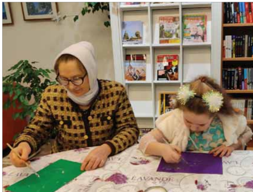
ЗАНЯТИЕ С ДОШКОЛЬНИКАМИ «БАБУШКА НА ЧАС»