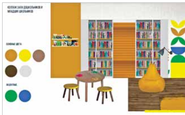
ДИЗАЙН-КОНЦЕПЦИЯ (КОЛЛАЖ) ЗАЛА ДОШКОЛЬНИКОВ И МЛАДШИХ ШКОЛЬНИКОВ

Концепция дизайна пространства объединит название библиотеки — «Радуга» и природное богатство региона. Природа и природные явления будут отражены в графическом оформлении стен, в визуализации данных, а также в форме и цвете мебели, декора.