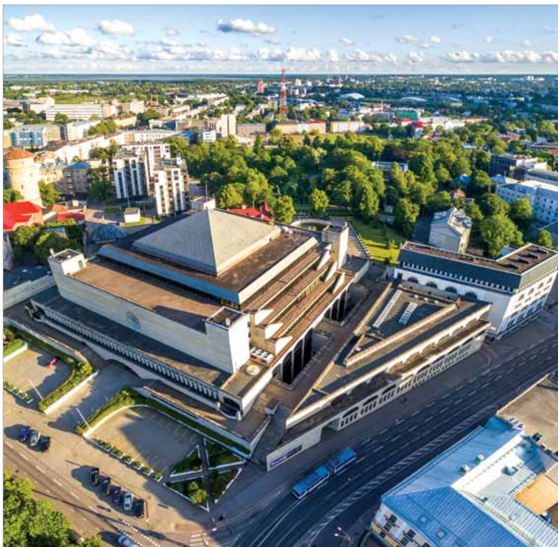
ЗДАНИЕ НАЦИОНАЛЬНОЙ БИБЛИОТЕКИ ЭСТОНИИ

Наиболее важные компетенции, которыми должен обладать сотрудник библиотеки, — социальные, независимо от того, работает ли он с читателями, ведет ли учебные курсы или занимается информационными технологиями. Немаловажный аспект, на который обратила внимание НБЭ при наборе новых сотрудников, — это обучение на протяжении всей жизни. Возраст в данном случае не имеет значения. Однако нельзя не отметить, что составляющая требуемых навыков — цифровая компетентность, и здесь между поколениями, бесспорно,