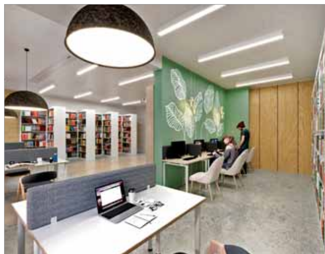
ДИЗАЙН-ПРОЕКТ НОВОЙ БИБЛИОТЕКИ № 250

Данные профессиональные компетенции библиотечного сообщества рассматриваются как системное, интегративное единство, синтез интеллектуальных и квалификационных составляющих, личностных характеристик и опыта, позволяющий сотрудникам использовать свой потенциал, осуществлять сложные виды деятельности, оперативно и успешно адаптироваться в постоянно изменяющемся обществе и профессиональной деятельности, поддерживая бренд «Библиотеки Зеленограда». ■