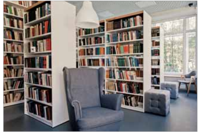
ИНТЕРЬЕР БИБЛИОТЕКИ № 254 ВЫПОЛНЕН В СКАНДИНАВСКОМ СТИЛЕ

культурным центром округа-спутника. Таким образом, более 60% всех площадей сети будут работать в обновленных пространствах и по единым стандартам.