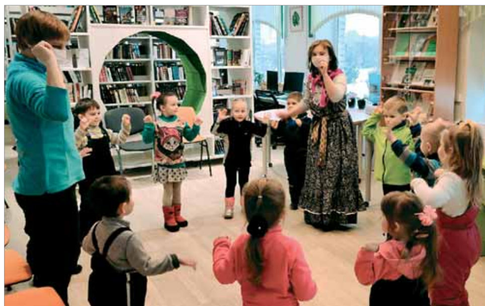
ПОСТАНОВКА КАРЕЛЬСКОЙ СКАЗКИ «ЛАПОТОК»

Из-за неопределенности правового статуса таких многофункциональных, а по мнению заведующего научно-методическим отделом Российской национальной библиотеки С.А. Басова, выступившего 18 февраля 2021 г. на первом заседании Всероссийского методического совещания, — многопрофильных учреждений — под вопросом стояла возможность участия не только центральных библиотек, но и структурных подразделений централизованных библиотечных систем/межпоселенческих библиотек в конкурсном отборе на создание модельных муниципальных библиотек в рамках реализации национального проекта «Культура». В 2019 г. проектный офис Российской государственной библиотеки (РГБ) определенно отказывал таким библиотекам в участии в конкурсном отборе, несмотря на то что они имеют библиотечный ОКВЭД 91.01. Однако после длительной переписки с федеральным проектным офисом и прове-