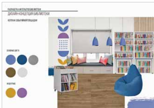
ДИЗАЙН-КОНЦЕПЦИЯ (КОЛЛАЖ) СОБЫТИЙНОЙ ПЛОЩАДКИ

информацией, с визуальным рядом мест Псковской области. Звуковое сопровождение цифрового контента — пение птиц, журчание родника и т. п. — передает атмосферу и настроение окружающего мира.