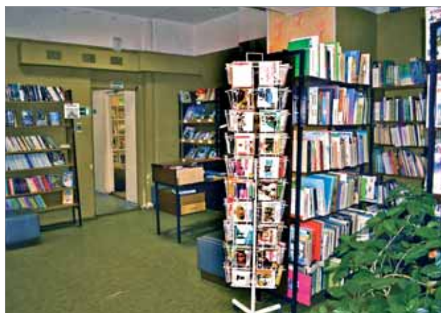
ЗАЛ ДЛЯ ПОДРОСТКОВ ДО МОДЕРНИЗАЦИИ

странством для встреч и общения, проведения мастер-классов и кинопоказов, и что самое главное — комфортной средой для многогранного развития детей;