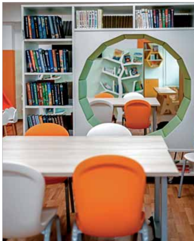
ДЕТСКОЕ ОТДЕЛЕНИЕ ЦЕНТРАЛЬНОЙ БИБЛИОТЕКИ № 249

В 2021 г. запланировано также начало капитального ремонта самого большого подразделения сети — Библиотеки театра и кино № 252, которая станет основным информационно-библиотечным