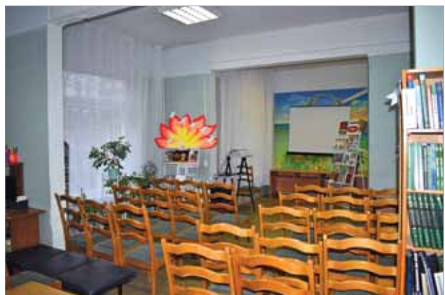
СОБЫТИЙНАЯ ПЛОЩАДКА ДО МОДЕРНИЗАЦИИ

Подростковый зал включает зоны обслуживания, новинок периодики, работы на персональных компьютерах, пространство для чтения и общения. Помещение оформлено в природных красках Полистовского заповедника, известного своими лесами, реками и ручьями, разнообразным растительным и животным миром. В зоне для чтения стоят диван и журнальные столики со столешницами в виде листьев деревьев. Центральный ряд стеллажей волнообразной формы напоминает изгибы многочисленных ручьев на территории Полистовья. В помещении предусмотрены уединенные места для работы и площадка для чтения и общения. В зоне общения у окна организован уголок для отдыха с пуфами, журнальным столом и креслами-мешками. В случае необходимости зоны подросткового зала можно объединить и обеспечить больше мест для читателей.