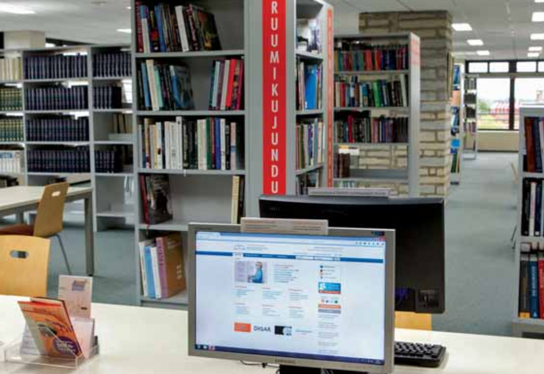
ЧИТАЛЬНЫЙ ЗАЛ ЛИТЕРАТУРЫ ПО ИСКУССТВУ НАЦИОНАЛЬНОЙ БИБЛИОТЕКИ ЭСТОНИИ

ствием для входа в читальную зону. Несмотря на неоднозначность решения, библиотека реализовала его на практике, чтобы стать ближе к читателю. Исходя из нашего опыта, очень важный вопрос, на который следует обратить внимание, — вход в библиотеку. Он способен стать барьером для ее посещения, поэтому мы спроектировали новый вход — люди, приходящие в НБЭ, открывают дверь и сразу попадают в читальную зону.