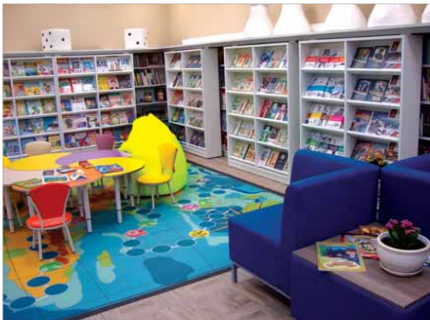
ИНТЕРАКТИВНАЯ ЗОНА ДЕТСКОГО АБОНЕМЕНТА ЦГСБ «ЦЕНТР ЛИТЕРАТУРНОГО КРАЕВЕДЕНИЯ ИМ. И.А. ГОНЧАРОВА» ЦБС Г. УЛЬЯНОВСКА

В 2021 г. выделено 12 млн руб. из областного бюджета и 3 млн руб. из муниципальных бюджетов на создание пяти библиотек. Четыре из них будут соответствовать региональному стандарту (Большечирклейская сельская библиотека Николаевского района, Абрамовская сельская библиотека Майнского района, Октябрьская сельская библиотека филиал Павловского района, Октябрьская сельская библиотека Чердаклинского района и одна — федеральному (Карсунская межпоселенческая центральная библиотека им. Н.М. Языкова).