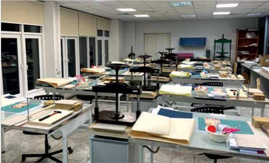
ОБОРУДОВАНИЕ РЕСТАВРАЦИОННОГО КЛАССА В РГБ

Несомненным преимуществом данного курса является то, что он дает не только теоретические знания: опытные преподаватели-практики делают все возможное, чтобы после окончания обучения слушатели смогли применять свои знания на практике. По завершении обучения выпускники программы смогут самостоятельно выбирать оптимальную модель реставрации (консервации) документов на бумажном носителе, применять на практике основные методы определения и устранения проявлений биоповреждений и методы контроля режима хранения документа.