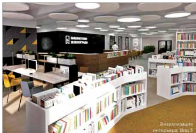
ДИЗАЙН-ПРОЕКТ БИБЛИОТЕКИ № 252

тенций сотрудников бренда «Библиотеки Зеленограда».