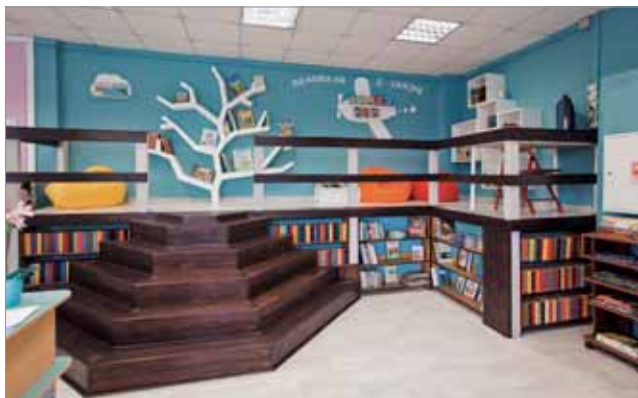
СКАЗОЧНАЯ ГОСТИНАЯ ЦЕНТРАЛЬНОЙ ДЕТСКОЙ БИБЛИОТЕКИ № 251 ПОСЛЕ ОБНОВЛЕНИЯ В РАМКАХ ПРОЕКТА «ТОЧКИ РОСТА»

располагается в «Новом городе» — так называется часть Зеленограда с одной стороны железной дороги с численностью населения более 106 тыс. человек. Актуальной стала работа кружков и студий, например курсов актерского мастерства «Арлекин», клуба по формированию культуры чтения «Читалкин». В Центральной детской библиотеке № 251 посещаемость гостиной сказок после обновления и внедрения внебюджетной деятельности выросла на 24% за экспериментальные восемь месяцев.