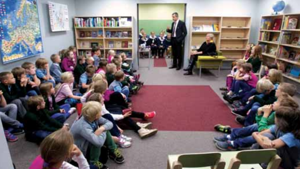
ДЕТСКИЙ ЗАЛ НАЦИОНАЛЬНОЙ БИБЛИОТЕКИ ЭСТОНИИ

наблюдаются большие различия. Молодежь обладает хорошими навыками в этой области, но не все должности требуют одинакового уровня цифровых знаний. Для нас важно, чтобы все сотрудники обладали компетенциями, отвечающими потребностям сегодняшнего дня, поэтому в 2019 г. НБЭ запустила программу цифровых компетенций с разными уровнями и модулями, связанными с цифровыми знаниями. Несмотря на то что НБЭ пользуется услугами внешней ИТ-компании, библиотекари должны развивать свои цифровые навыки и быть опытными пользователями ИТ-технологий. В 2018 г. мы предприняли ряд мер в этом направлении, чтобы самостоятельно принимать правильные решения о том, какое программное обеспечение следует приобрести, например, для цифрового архива и т. п.