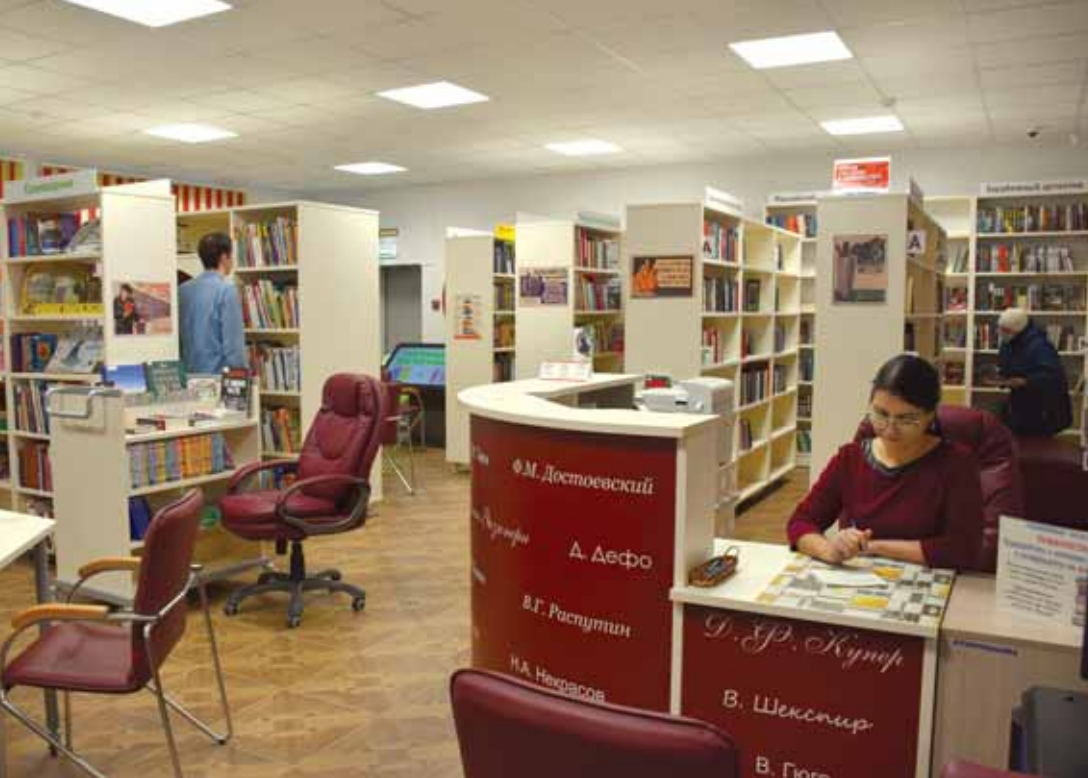
ЗОНА ОТКРЫТОГО ДОСТУПА

онным центром микрорайона, в том числе в сфере локального краеведения. Появились и укрепилась партнерские связи, реализовывались совместные краткосрочные и долгосрочные образовательные, просветительские, культурные и социальные проекты. Интересные мероприятия в библиотеке и в «Библиотечном дворе» заметили на муниципальном уровне, появилось целевое финансирование. В библиотеку пришли читатели!