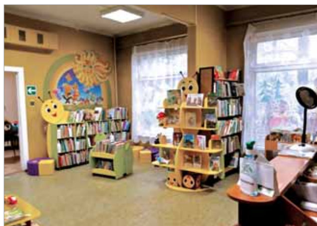
ЗАЛ ДЛЯ ДОШКОЛЬНИКОВ И МЛАДШИХ ШКОЛЬНИКОВ ДО МОДЕРНИЗАЦИИ

Установленная в холле инфозона предназначена для ознакомления со своевременной и актуальной