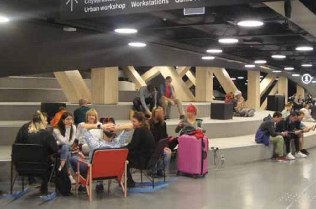
ЗОНА ОТДЫХА И ОБЩЕНИЯ

Рассмотрим бесплатные услуги для пользователей на втором этаже более подробно: