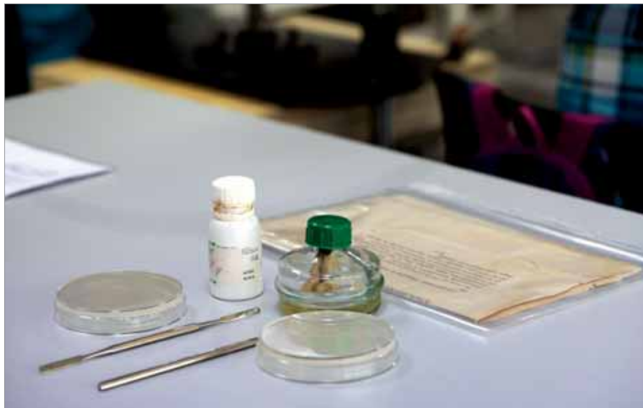
ПРАКТИЧЕСКОЕ ЗАНЯТИЕ ПО ПРЕВЕНТИВНОЙ КОНСЕРВАЦИИ БИБЛИОТЕЧНЫХ ФОНДОВ В РГБ

при участии специалистов федеральных библиотек (Российской национальной библиотеки (РНБ), Всероссийской государственной библиотеки иностранной литературы им. М.И. Рудомино, Государственной публичной исторической библиотеки России, Российской государственной библиотеки для слепых), провел Всероссийский мониторинг состояния библиотечных фондов. В исследовании участвовали 252 федеральные и центральные библиотеки субъектов РФ, в том числе универсальные научные, детские, юношеские и библиотеки для молодежи, а также специализированные библиотеки для слепых и слабовидящих. Было проанализировано состояние 283 761 177 ед. хр. (что составляет около 50% общего библиотечного фонда РФ и почти 95% редкого и ценного фонда) [1].