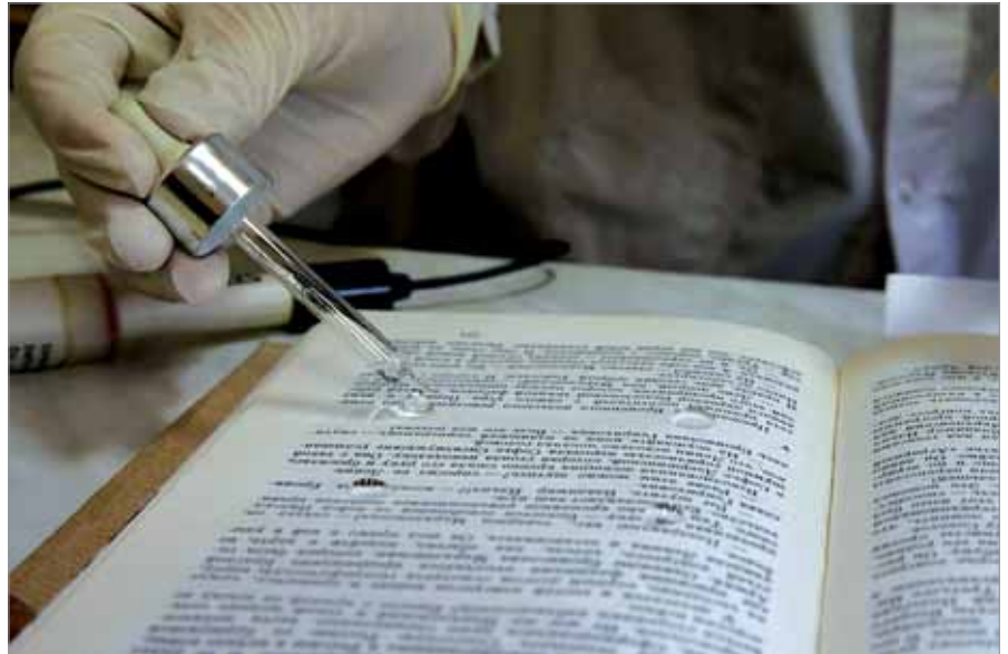
ОПРЕДЕЛЕНИЕ КИСЛОТНОСТИ БУМАГИ

связаны с сохранением документов на бумажных носителях. Дополнительная образовательная программа «Менеджмент в консервации документов», не имеющая аналогов на российском рынке образовательных программ, сочетает в себе комплекс базовых знаний, необходимых специалистам, в чьи профессиональные задачи входит управление деятельностью отделов консервации.