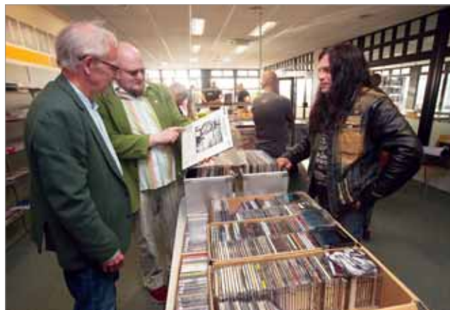
МЕЖДУНАРОДНАЯ НОЧЬ МУЗЕЕВ

Всего в Эстонии одна тысяча библиотек, их ядро — около 500 — составляют публичные библиотеки, затем идут школьные — 300, их чуть больше, чем академических и научно-специальных библиотек, и Национальная библиотека. У нас сложилась хорошая система публичных библиотек, начало которой было положено более 100 лет назад. В результате административной реформы 2016 г. количество локальных муниципалитетов в Эстонии сократилось