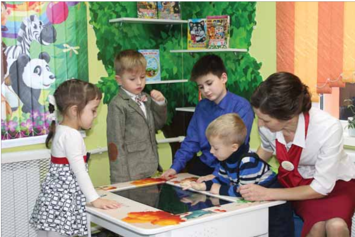
КУРСКАЯ ОБЛАСТЬ. ЦЕНТРАЛЬНАЯ ДЕТСКАЯ БИБЛИОТЕКА-ФИЛИАЛ МКУК «МЕЖПОСЕЛЕНЧЕСКАЯ БИБЛИОТЕКА ДМИТРИЕВСКОГО РАЙОНА»

рует Центр непрерывного образования и повышения квалификации творческих и управленческих кадров в сфере культуры, созданный на базе проектного офиса в Российской государственной библиотеке. При этом по-прежнему важно внимание к традициям, поэтому в обучении сохранены классические библиотечные компетенции, например комплектование и обеспечение сохранности фондов. В 2020 г. в 172 библиотеках фонд пополнился почти на 700 тыс. экземпляров общей стоимостью более 214 млн рублей.