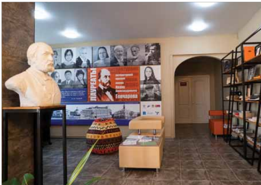
ЗОНА ЛИТЕРАТУРНОГО КАФЕ В ЦГСБ «ЦЕНТР ЛИТЕРАТУРНОГО КРАЕВЕДЕНИЯ ИМ. И.А. ГОНЧАРОВА» ЦБС Г. УЛЬЯНОВСКА

дителями признаны заявки от девяти библиотек, пять из которых уже модернизированы.