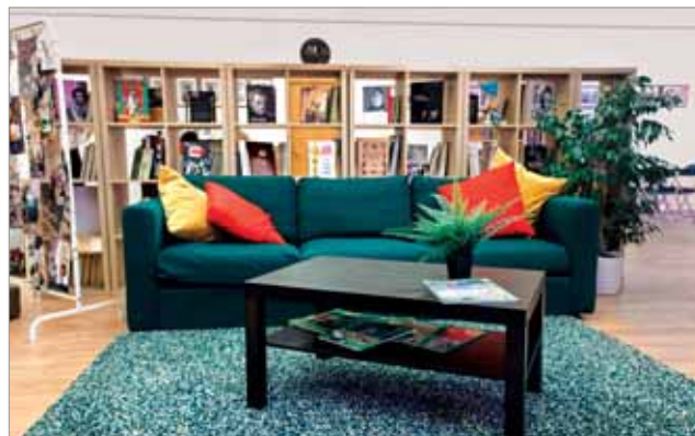
БИБЛИОТЕКА № 252 ПОСЛЕ ОБНОВЛЕНИЯ В РАМКАХ ПРОЕКТА «ТОЧКИ РОСТА»

ных мероприятий. В округе-спутнике легко строить бренды, которые берут за основу место силы — Зеленоград.