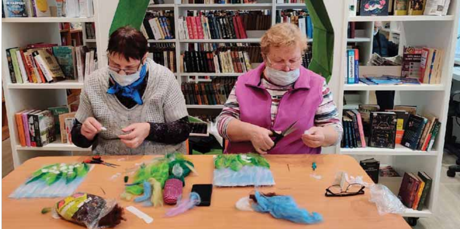
АРТ-ЧАС «ЛАНДЫШИ: ЖИВОПИСЬ ШЕРСТЬЮ»

го сообщества; устойчивых традиций поддержки библиотек органами местного самоуправления; развитой инфраструктуры населенного пункта и соответствующих нормативам помещений библиотек.