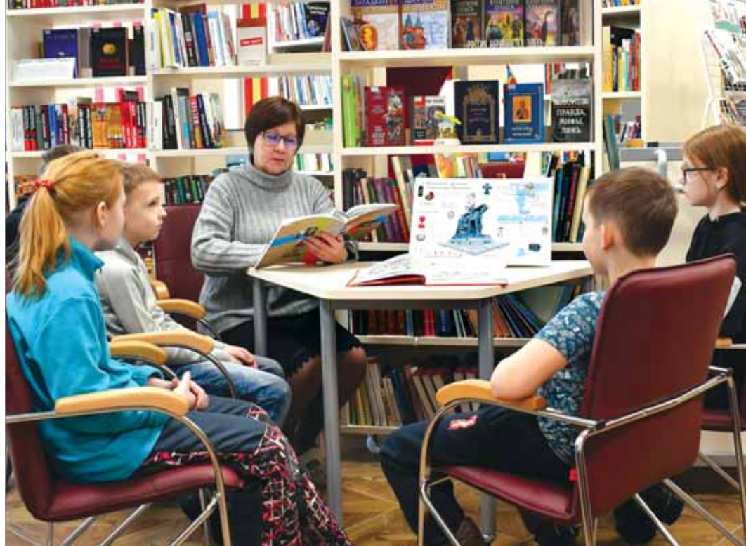
ЗНАКОМСТВО С КНИГОЙ О ПСКОВЕ

библиотеке — открытая планировка, доступность, многофункциональность.