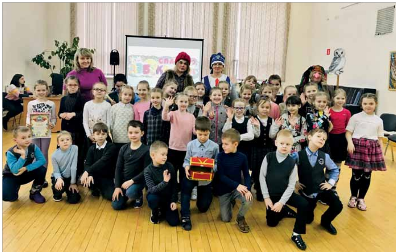
ПРАЗДНИК АЗБУКИ «БАБА-ЯГА ПРОТИВ»

местного самоуправления на этапах подготовки конкурсных заявок на создание модельных библиотек в рамках национального проекта «Культура»;