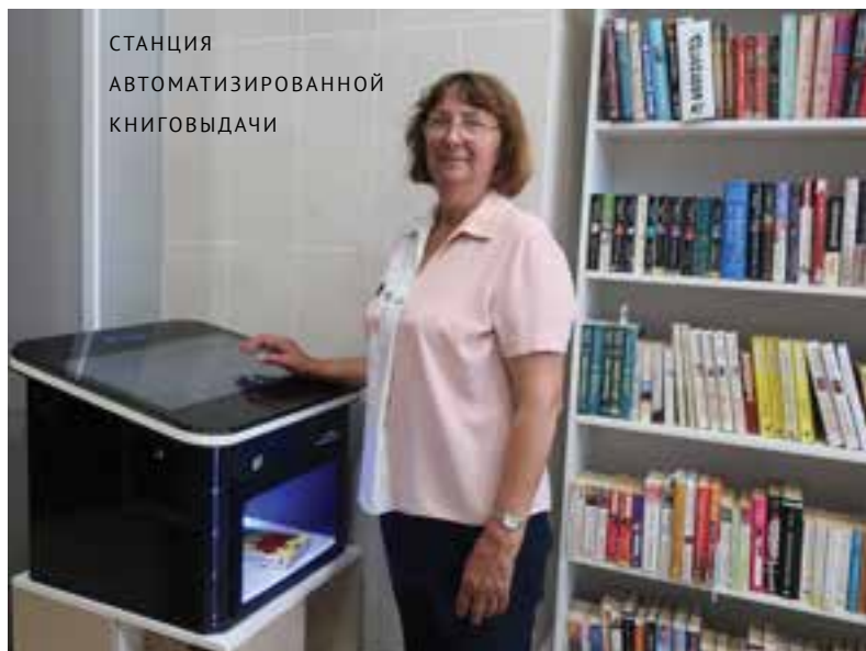
СТАНЦИЯ АВТОМАТИЗИРОВАННОЙ КНИГОВЫДАЧИ