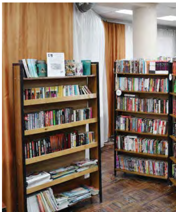
КНИЖНЫЙ ЗАЛ БИБЛИОТЕКИ-ФИЛИАЛА № 20 ДО РЕМОНТА

алисты Центральной городской библиотеки (ЦГБ) им. Н. Островского, являющейся методическим центром, и библиотеки-филиала № 20 еще только намечали основные направления работы и обсуждали новые идеи. В связи со сжатыми сроками подачи документов оперативно было проведено анкетирование читателей и сотрудников библиотеки, опрошены представители учреждений и организаций, непосредственно работающих с библиотекой. Результаты опроса позволили выявить проблемы и найти пути решения в организации работы библиотеки, определить векторы ее развития.