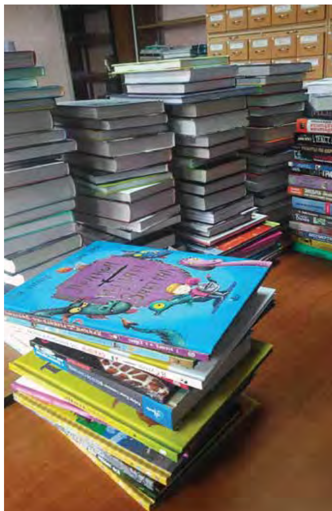
ПОСТУПЛЕНИЕ НОВЫХ КНИГ В БИБЛИОТЕКУ-ФИЛИАЛ № 20

Всем, кто еще только планирует участие в конкурсе, хочется порекомендовать еще на стадии подготовки документов внимательно прорабатывать все детали, касающиеся постановки задач и сроков исполнения, очень тщательно готовить смету проекта и искать надежных и проверенных поставщиков. А еще пожелать работоспособности, оптимизма, веры в успех и креативных идей!