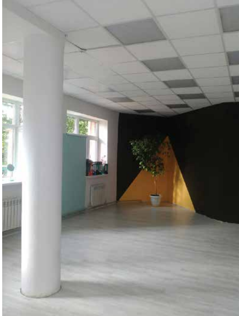
ПОМЕЩЕНИЕ БИБЛИОТЕКИ-ФИЛИАЛА № 20 ВО ВРЕМЯ РЕМОНТА

Благодаря участию в проекте и полученным финансовым средствам значительно обновится книжный